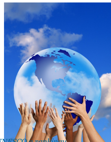
UNESCO a rankingy

je vývoj a kľúčové priority a budúce smerovanie UNESCO v tejto oblasti.